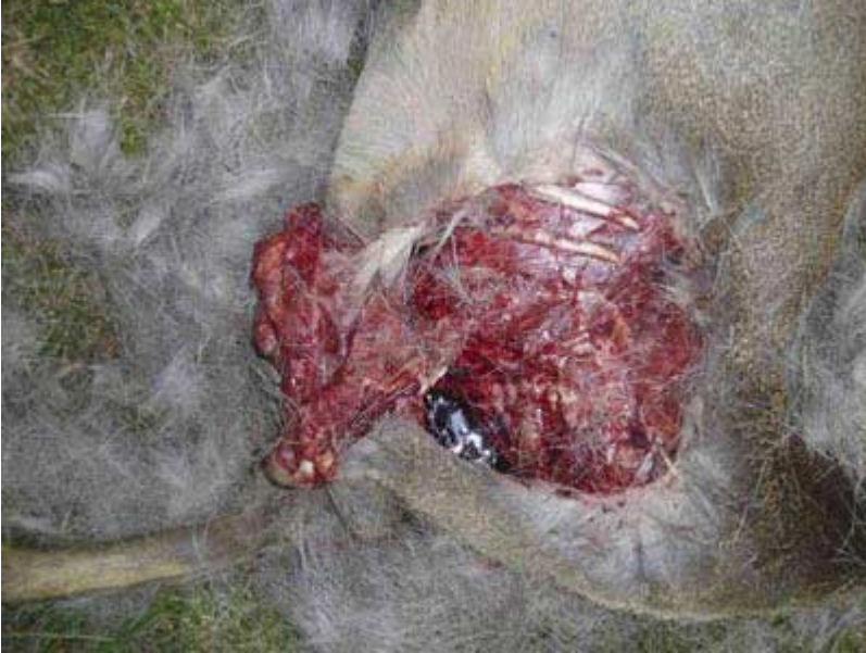
Lodjuret har ätit några kilo kött på höger framben och bog. Björkefall Kyrkhult i Blekinge.